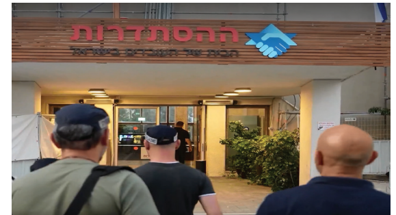
מפרשות השחיתות הגדולות שנחקרו בישראל. השוטרים פושטים על בית ההסתדרות

מהפצ"רית ועד ההסתדרות: שבוע של כאוס, קונספירציות, וקריסת אמון ציבורי