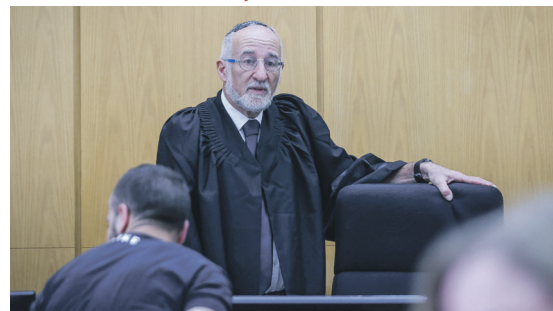
שופט חיצוני יחקור את אירועי ההדלפה והטיח. אשר קולה

גם לאחר העתירות שהוגשו לבג"צ, המשיכה הפצ"רית לתחזק את הטיח. בתצהיר נוסף שמסרה לבית המשפט, טענה, כי "לאחר בדיקה מעמיקה, לא נמצאה ולו אינדיקציה ראשונית למקור ההדלפה".