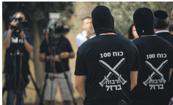
הטעות הראשונה החלה במעצר המשפיל בשדה תימן. "כח מאה" ששמר על מחבלי הנוחבה

העובדות שאי אפשר להסתיר: מעצרים רעולי פנים, שקרים לבג"ץ וסרטון מזויף