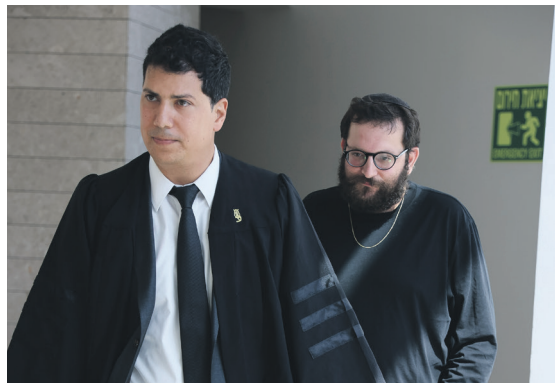
השמאל ניסה בתיסכולו להשוות בין יועצו של ראה"מ לפצ'רית. יונתן אורין

השוואות שקריות וספינים לרוב: כך מנסה השמאל לברוח מפרשת הפצ'רית